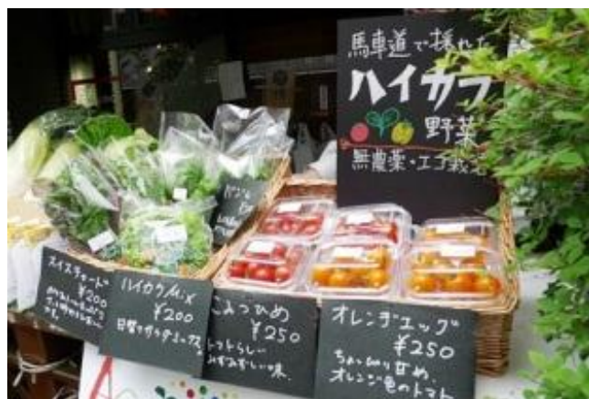
アンテナショップ「驛(うまや)テラス」での販売風景