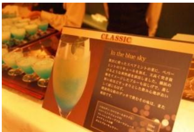
「横浜カクテルクルーズ 2011」にてカクテル素材となるハーブを提供