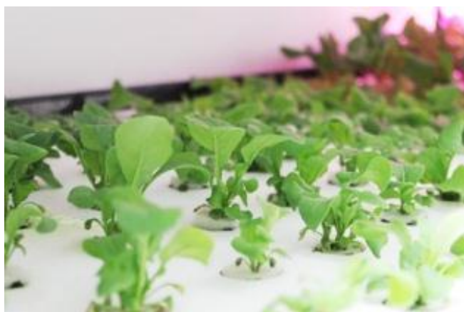
「ハイカラ野菜」栽培風景

その他、「横浜カクテルクルーズ 2011」や「ヨコハマハム大特売会」に出店するなど、一大消費地・横浜にある“みなとみらいにいちばん近い農園”として、さまざまな地元企業や飲食店、イベントでのコラボレーションも展開しています。